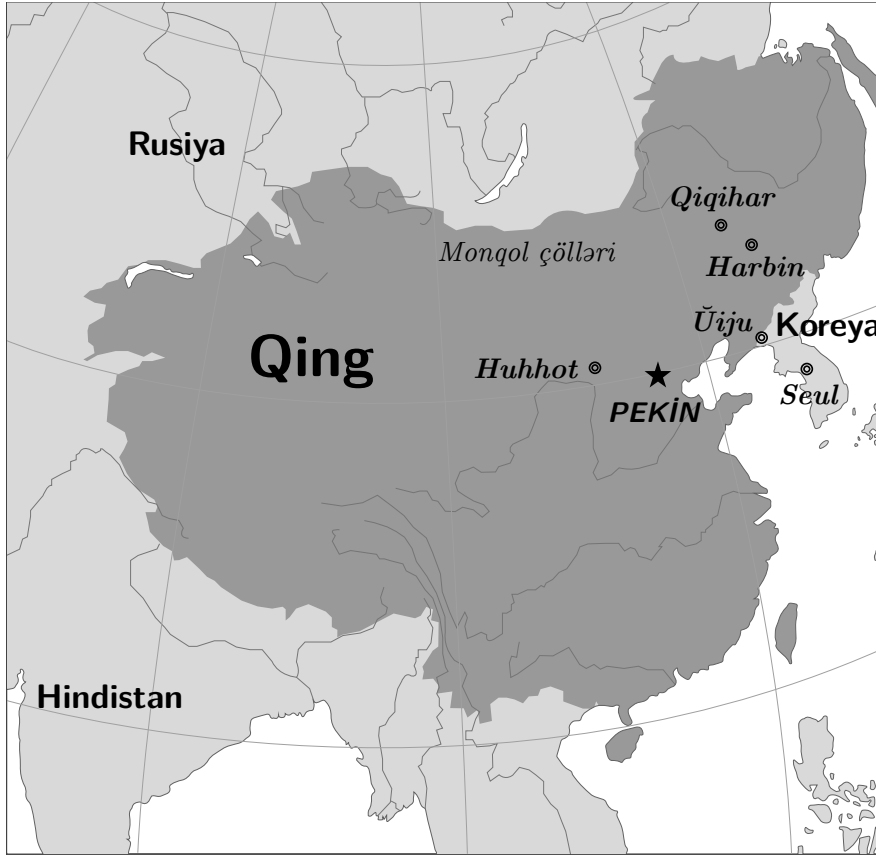
Qing sülaləsinin xəritəsi (təxminən 1760)

△ Mancur dili tunquz-mancur dil ailəsinə aiddir. Şimal-Şərqi Asiyada tarixi Mancuriya ərazisində mancur tayfaları tərəfindən istifadə olunurdu. Mancurlar tərəfindən qurulan Qing (köhnə mənbələrdə Tsinq) sülaləsinin rəsmi dillərindən biri idi. Vaxt keçdikcə mancur dili tədricən Çin dili ilə əvəz olundu və bu gün təkcə bir neçə onluq sayı qədər ana dili qalıb.