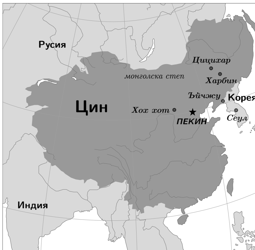
Карта на династия Цин (ок. 1760 г.)

△ Манджурският език е от тунгузкото семейство. На него са говорили манджурските племена в историческата област Манжурия в североизточна Азия. Той е бил един от официалните езици на династия Цин, основана от манджурите. С течение на времето манджурският е бил изместен от китайския и така към днешни дни са останали само няколко десетки носители на езика.