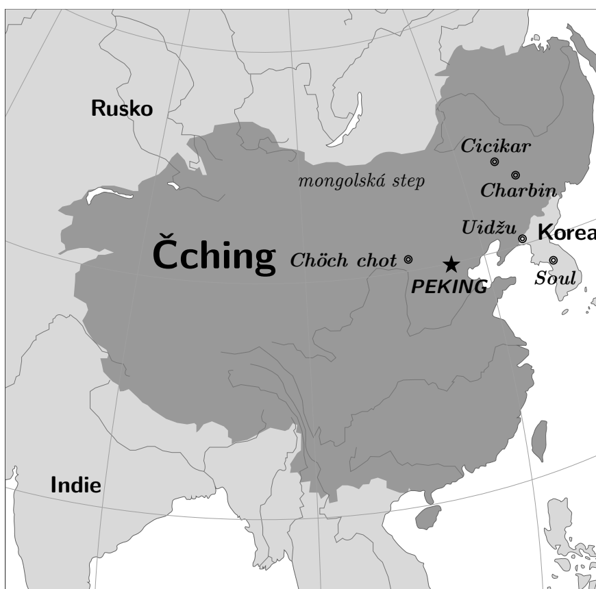
Mapa dynastie Čching (cca 1760)

△ Mandžuštinya náleží do tunguzské rodiny. Mluvily jí mandžuské kmeny v historické oblasti Mandžusko v severovýchodní Asii. Byla jedním z oficiálních jazyků dynastie Čching, kterou založili Mandžuoové. S postupem času mandžuštinu postupně nahradila čínština a v současnosti na světě zbývá jen několik desítek rodilých mluvčích mandžuštiny.