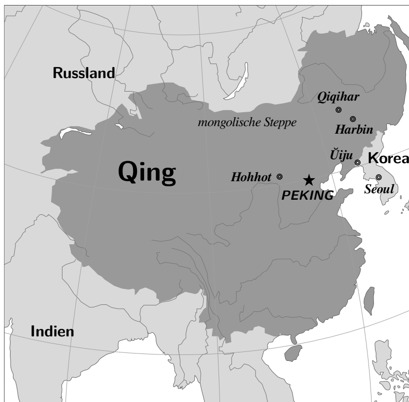
Karte der Qing-Dynastie (um 1760)

△ Das Mandschu gehört zur tungusischen Sprachfamilie. Es wurde von den Mandschu-Stämmen der historischen Region Mandschurei in Nordostasien gesprochen. Es war eine der offiziellen Sprachen der Qing-Dynastie, die von Mandschu gegründet wurde. Im Laufe der Zeit wurde die mandschurische Sprache durch die chinesische Sprache ersetzt, sodass es heutzutage nur noch einige Dutzende von Muttersprachler davon gibt.