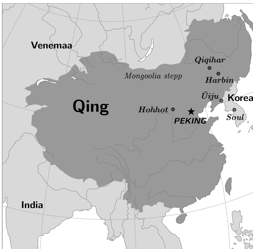
Qingi dünastia kaart (u 1760)

△ Mandžu keel kuulub tunguusi keelkonda. Seda kõnelesid mandžu hõimud ajaloolises Mandžuuria regioonis Kirde-Aasias. See oli Qingi dünastia üks ametlikke keeli; dünastiale olid aluse pannud mandžud. Aegade jooksul on hiina keel mandžu keele välja tõrjunud, nii et vaid paar tosinat emakeelset kõnelejat on tänapäeval järel.