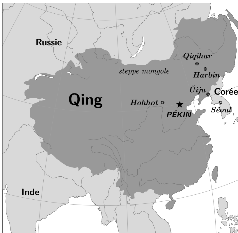
Carte de la dynastie des Qing (vers 1760)

△ Le mandchou fait partie de la famille toungouse. Il était parlé par les tribus mandchoues dans la région historique de la Mandchourie en Asie du Nord-Est. Il était une des langues officielles de l'empire des Qing, fondé par les Mandchous. Au cours du temps la langue mandchoue était substituée pour la plupart par la langue chinoise, ne laissant que quelques dizaines de locuteurs natifs de nos jours.