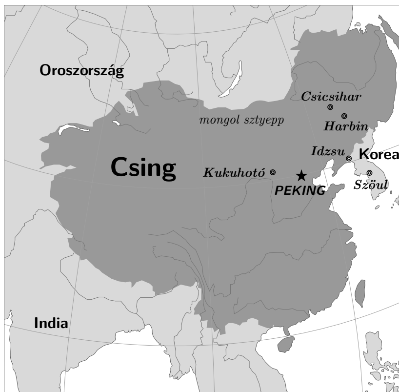
A Csing-dinasztia térképe (1760 körül)

△ A mandzsu nyelv a tunguz családkhoz tartozik. Az északkelet-ázsiai Mandzsúria történelmi régiójában élt mandzsu törzsek beszélték. A mandzsuk által alapított Csing-dinasztia egyik hivatalos nyelve volt. Az idő múlásával a mandzsu nyelv használatát többnyire felváltotta a kínai nyelv, így napjainkban csak néhány tucat anyanyelvű maradt.