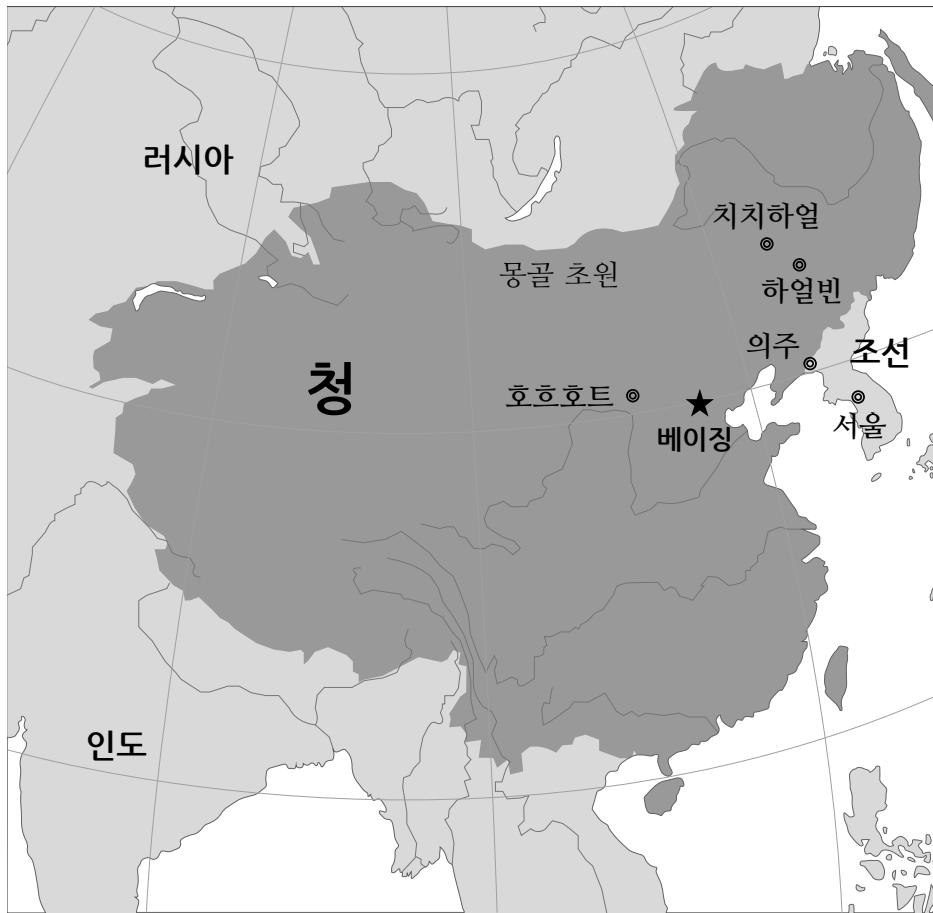
청나라의 지도 (1760년경)

△ 만주어는 퉁구스어족에 속한다. 동북아시아의 만주라 불리는 역사적 지역에서 만주족에 의해 사용되었다. 만주족에 의해 설립된 청 제국의 공용어 중 하나이기도 했다. 시간이 흐름에 따라 만주어의 사용은 중국어(한어)로 대체되어 현재는 원어민이 수십 명만 남아있다.