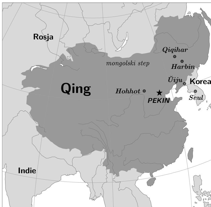
Mapa dynastii Qing (ok. 1760)

⚠ Język mandżurski należy do rodziny tungusko-mandżurskiej. Używany był przez plemiona mandżurskie w historycznym regionie Mandżurii w Azji Północno-Wschodniej. Był jednym z języków urzędowych dynastii Qing, założonej przez Mandżurów. Z biegiem czasu język mandżurski został stopniowo wyparty przez język chiński, tak że dziś pozostaje jedynie kilkudziesięcioro jego rodzimych użytkowników.