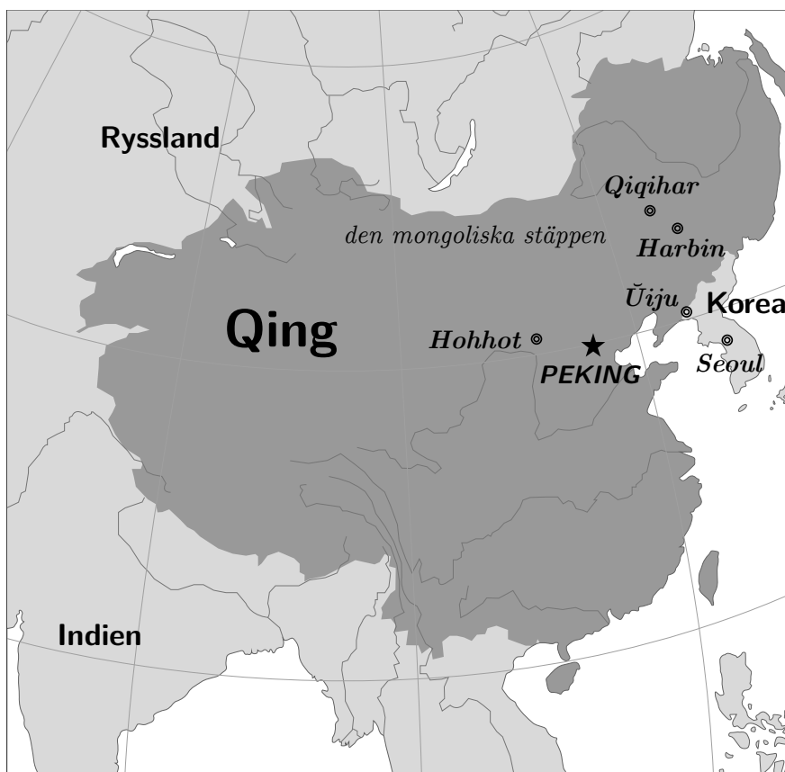
Karta över Qing-dynastin (cirka 1760)

△ Manchuiska tillhör den tungusiska språkfamiljen. Det talades av de manchuiska folken i den historiska regionen Manchuriet i nordöstra Asien. Det var ett av de officiella språken i Qing-riket, vilket grundades av manchuerna. Under årens lopp blev manchuiskan gradvis ersatt av kinesiska, och idag finns endast några dussin modersmålstalare kvar.