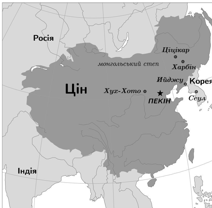
Карта династії Цін (бл. 1760 р.)

△ Маньчжурська мова належить до тунгусо-маньчжурської родини мов. Нею говорили маньчжурські племена в історичному регіоні Маньчжурія, розташованому в північно-східній Азії. Вона була однією з офіційних мов династії Цін, заснованої маньчжурами. З часом маньчжурська мова була витіснена китайською, тож на сьогодні вона налічує лише кілька десятків носіїв.