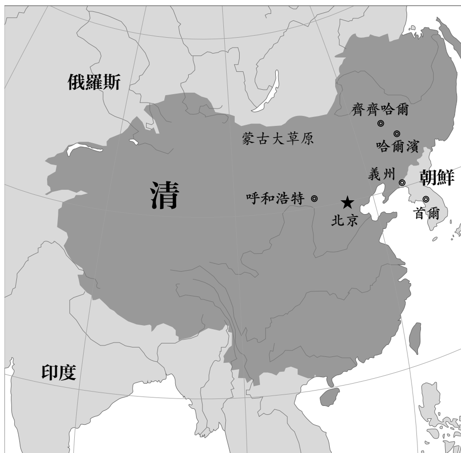
大清全圖 (約 1760 年)

△ 滿語屬於通古斯語系。以往在中國東北地區由滿族各部落所使用，。由滿族所建立的清帝國曾將其用作官方語言之一。隨著時間的推移，漢語已基本上取代了滿語的使用，如今以滿語為母語者不過數十。